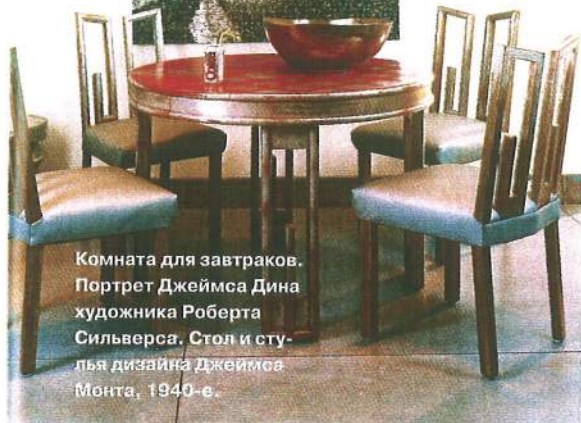
Комната для завтраков. Портрет Джеймса Дина художника Роберта Сильверса. Стол и стулья дизайна Джеймса Монты, 1940-е.