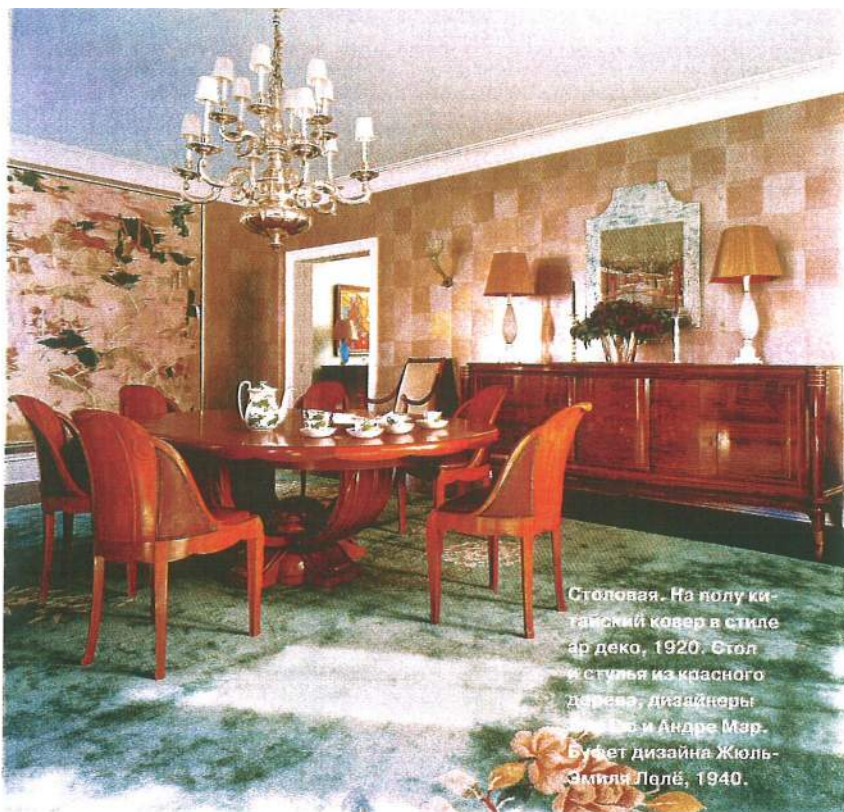
Столовая. На полу китайский ковер в стиле ар деко, 1920. Стол и стулья из красного дерева, дизайнеры Жюль-Эмиль Лолё и Андре Мар. Буфет дизайна Жюль-Эмиль Лолё, 1940.